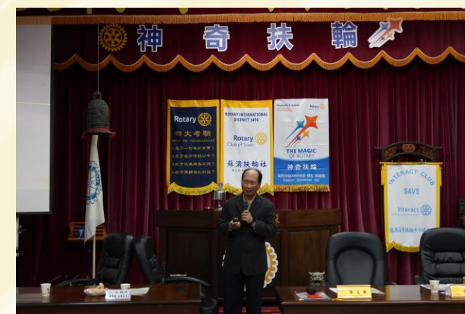
10/30(三)邀請行政院政務委員 吳澤成部長蒞臨專題演講