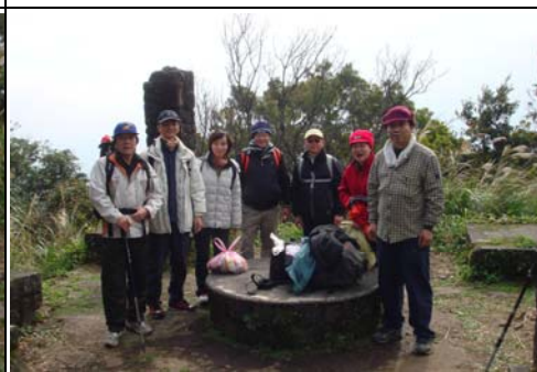
祭完五臟廟準備再出發