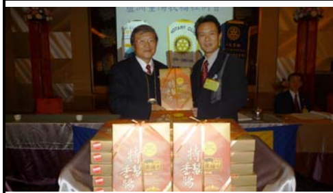
社長致送春節禮品