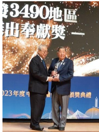
參加中華扶輪教育基金會創立 47 週年暨 中華扶輪獎學金頒獎典禮