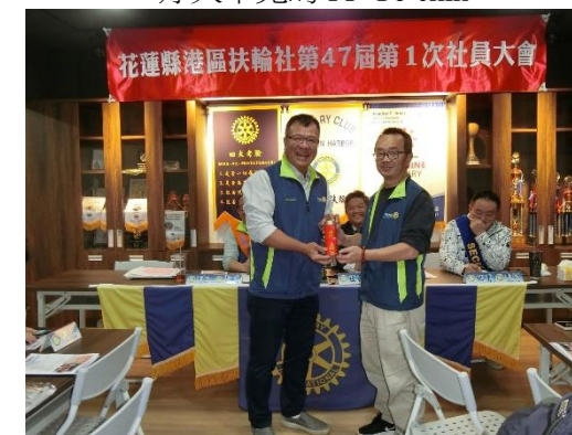
Fish 拍得 PP Civil 出國帶回之紀念品