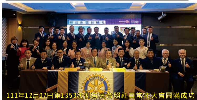
111年12月07日第1353次例會大合照社員常事大會圓滿成功