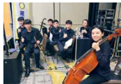
羅高音樂班演奏準備