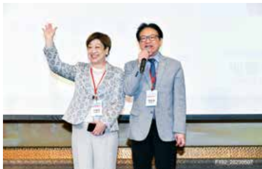
■ DG 親自介紹RIDN