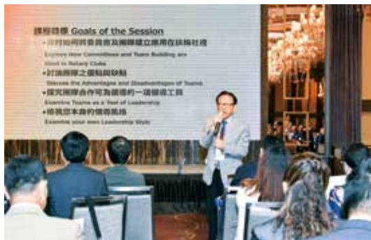
■ DG Ethan親自傳授寶貴的經驗