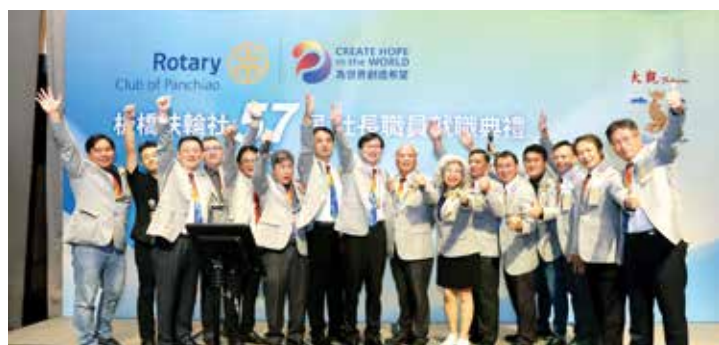
■ 板橋扶輪社社長與國際扶輪3490地區總監特助、助理總監、二分區各社新任社長與秘書合照

擴大辦理執行已邁入第 16 年的「小太陽計畫」，鼓勵扶輪社社員年輕子女一起加入，為缺乏家庭支持資源的孩子提供英語課輔，讓更多弱勢家庭能夠受惠。