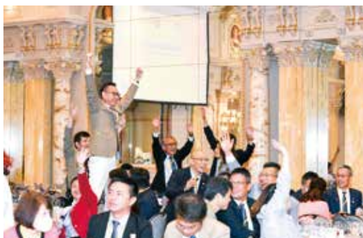
■ 學員參與情況熱烈