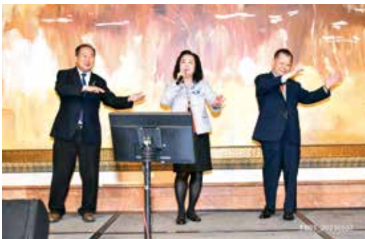
李校長與DGE伉儷合唱一曲