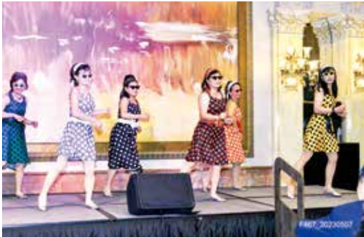
林口社夫人們的精彩舞蹈表演