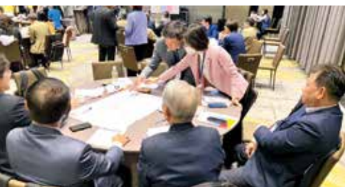
認真準備發表為了獎金拚了！