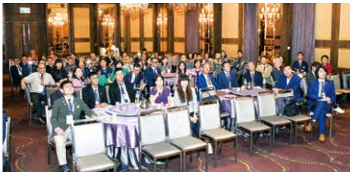
■ 學員聚精會神聽講