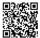
活動照片請掃描 QR Code