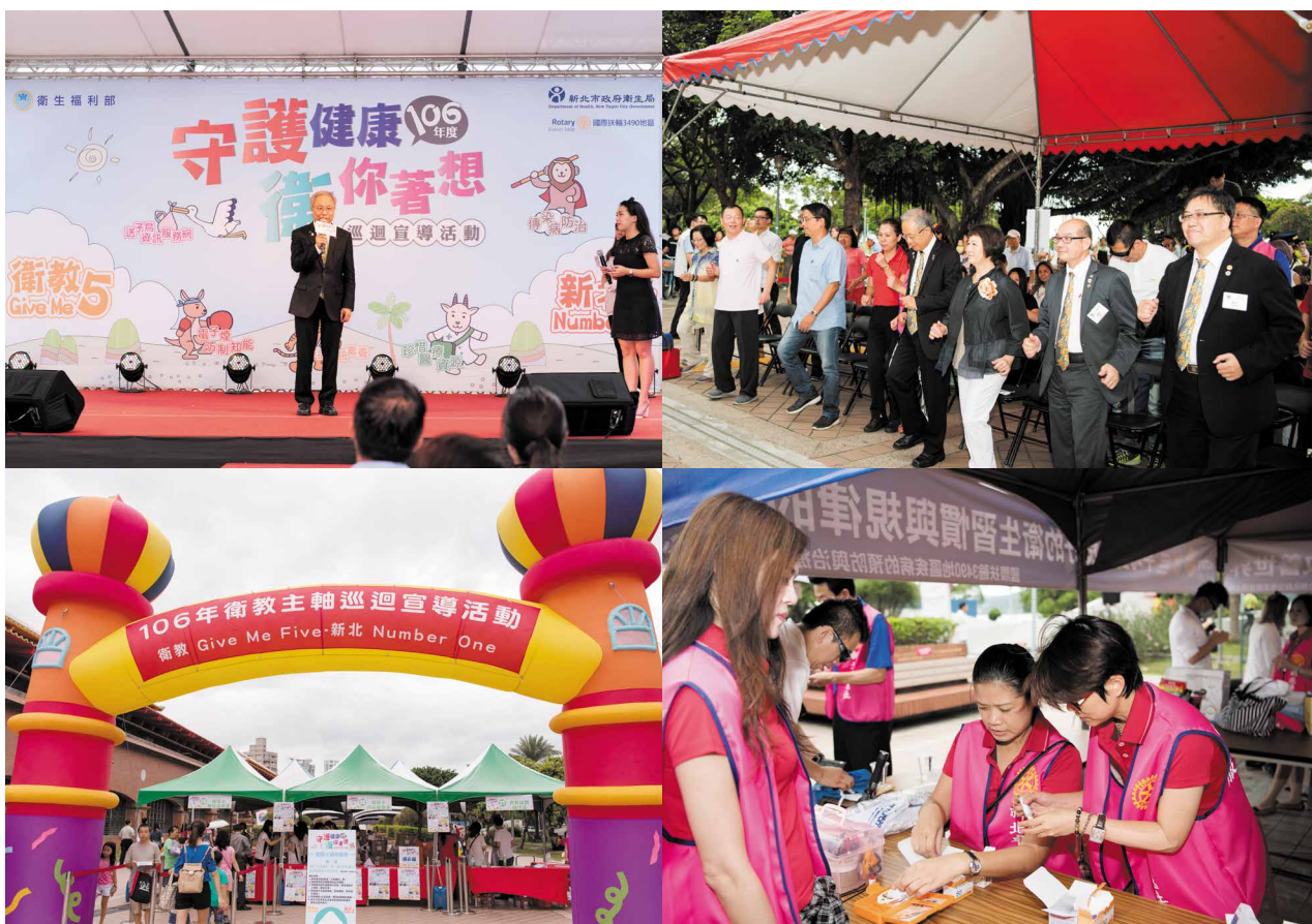
▲ 準備為民眾提供血糖測量

合希望將此活動推廣到國際扶輪3490地區之基隆、宜蘭、花蓮等其他分區，讓更多民眾受益。