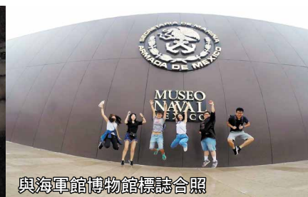
與海軍館博物館標誌合照