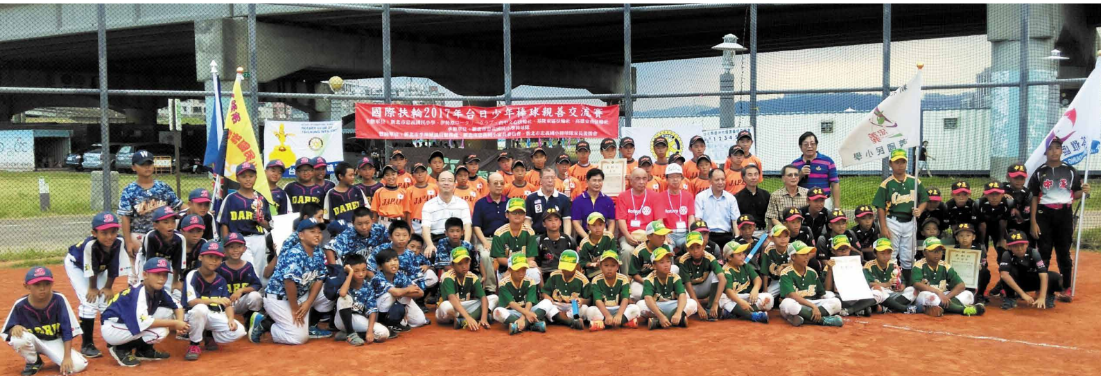
▲2017台日少年棒球親善交流賽中，全體參賽之棒球隊師生暨各主辦扶輪社一同合影