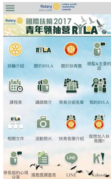
◀ APP 畫面示意圖