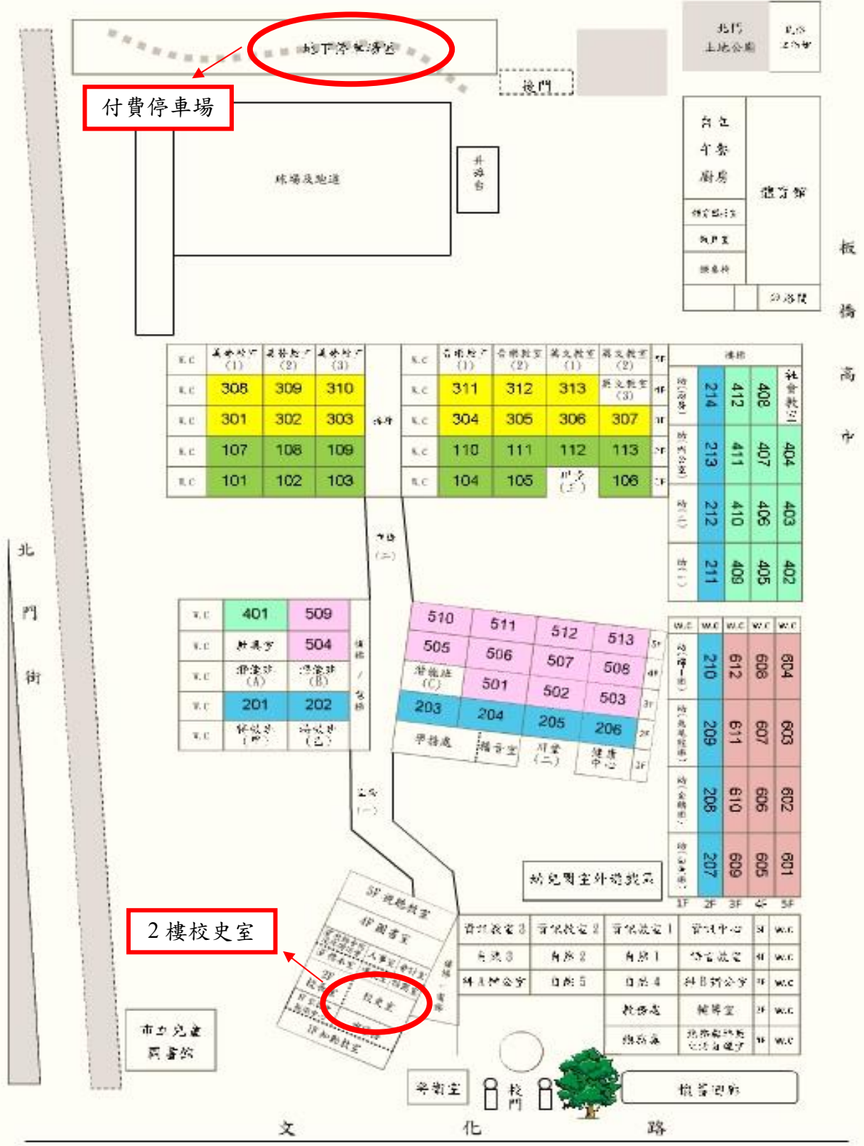
新北市板橋區板橋國民小學 105 學年度校舍平面圖