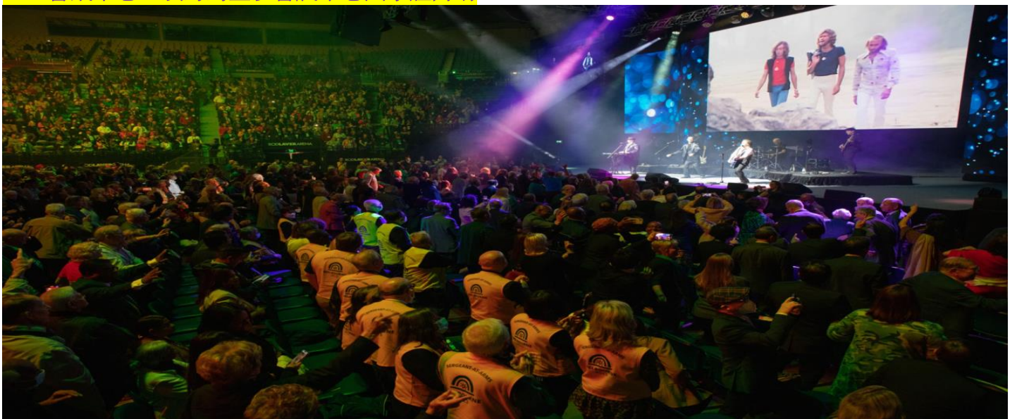
2023 年墨爾本會場閉幕式場景之一