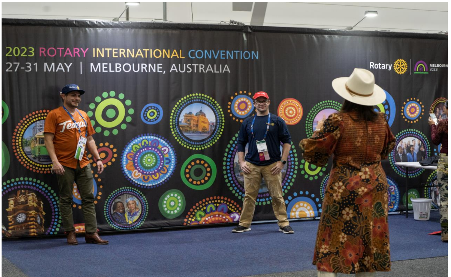
2023 年友誼之家場景之一