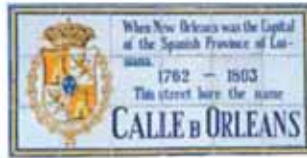
蔚為傳奇的法國區