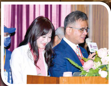
▼ 感謝第一日兩位司儀，三重 中央社VP Bridge及羅東西區 社Joy專業主持