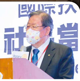
▼ 社長當選人訓練 會承辦社PP Light 主委致詞