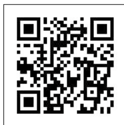
國際扶輪3490地區 22-23年度 社務手冊彙編

本年度各項社務活動及目標之績效，設有獎勵評分表，請各社執行秘書協助爭取分數，一起創造顛峰。茲將 22-23 年度訓練教材及扶輪知識整理彙編成 QR code，供各位社員隨時查閱，以利社務順利推動，最後順祝各社社務昌隆，各位社員身體健康，平安幸福！🌸