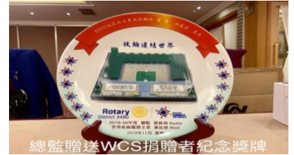
總監贈送WCS捐贈者紀念獎牌

★【甘尼小學捐贈儀式】WCS 計劃每分區認捐一間教室給勃固甘尼希望小學、每間教室66萬元分33個單位，每單位2萬元、鼓勵各社社友踴躍認捐、11月23日上午10點將舉行驗收啓用儀式。