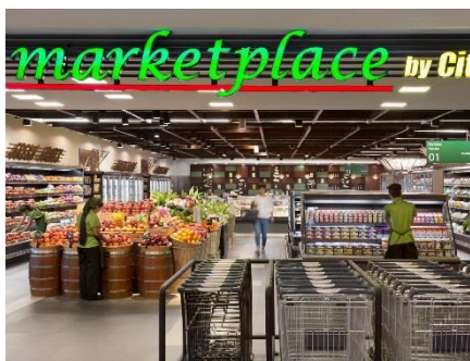
飯店 B1 的超市，營業到晚上十點！