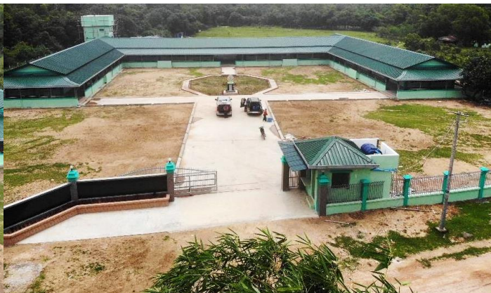
【柏固甘尼小學 捐贈啟用典禮】