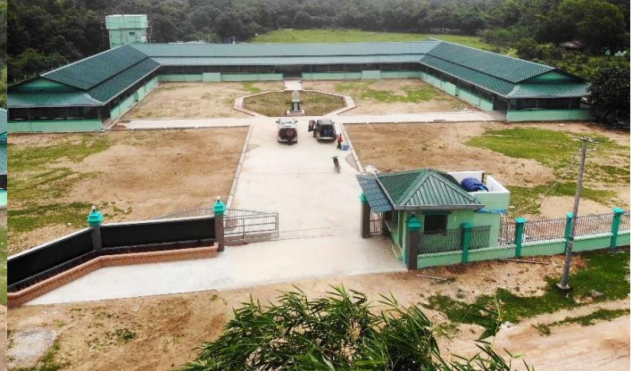
【柏固甘尼小學 捐贈啟用典禮】典禮結束後，前往...