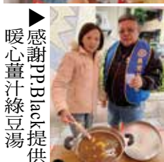
▶感謝PP.Black提供暖心薑汁綠豆湯