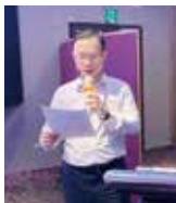
▲節目主委 HR來賓介紹