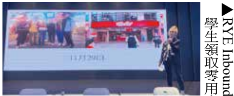
▲小艾中文心得報告