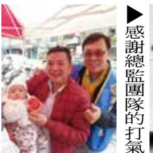
▶感謝總監團隊的打氣