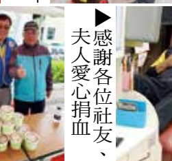
▶感謝各位社友、夫人愛心捐血