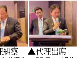
▲代理糾察 P.P.Muji報告 ▲代理出席 P.P.Tony報告