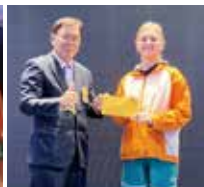
▲RYE Inbound 學生領取零用金