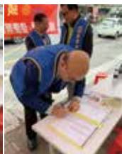
▶感謝九分區助理總監及祿姆一同共襄盛舉