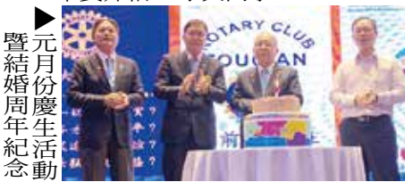
▶元月份慶生活動暨結婚周年紀念