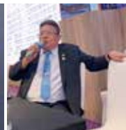
▲感謝PP.Black 獻唱生日快樂