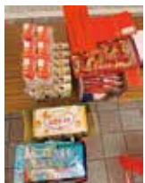
▲感謝社長伉儷贊助捐血贈品手工麵、天賜良緣餐卷20張、飲料及餅乾