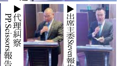
▶代理糾察 PP: Scissors報告