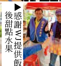
▶感謝WT提供飯後甜點水果