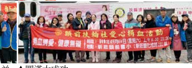
▲感謝各位社友、夫人踴躍參與熱心公益 ▲圓滿大成功