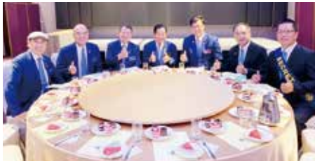
▲總監團隊與社長、秘書、社長當選人會晤