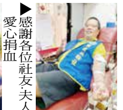
▶感謝各位社友夫人愛心捐血