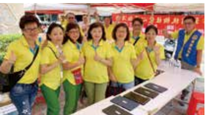
▶感謝各位社友夫人踴躍參與做愛心