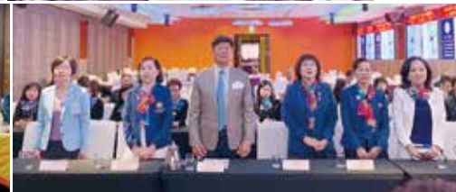
▲歡迎各社社長、秘書