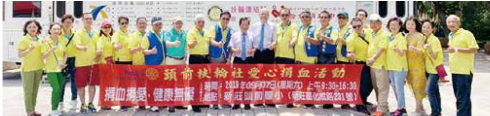
▶感謝第九分區助理、總監及各社社長、秘書一同共襄盛舉