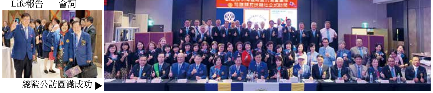
總監公訪圓滿成功 ▶