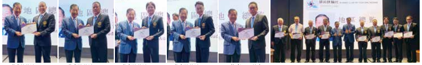
▲恭喜前社長P.P.Scissors ▲恭喜前社長P.P.Muji ▲恭喜前社長P.P.Tony ▲恭喜前社長I.P.P.CPA ▲恭喜Life社友