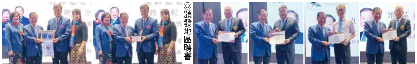
◎頒發地區聘書 ▲總監伉儷致贈社長伉儷紀念品 ▲恭喜創社社長C.P.Net ▲恭喜前社長P.P.Black ▲恭喜前社長P.P.Gordon ▲恭喜前社長P.P.Tom