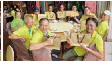
▲感謝社長伉儷贈送中秋禮盒