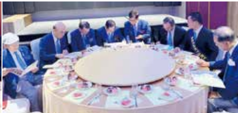
▲總監團隊與社長積極討論中