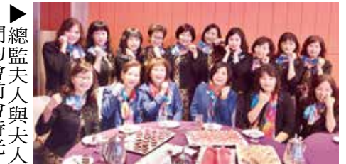
▶總監夫人與夫人們的會前會時光