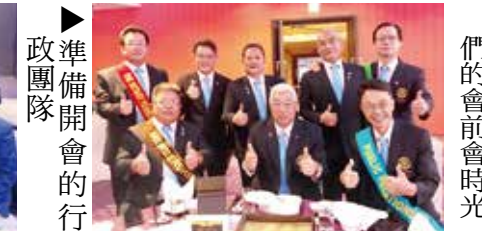
▶準備開會的行政團隊