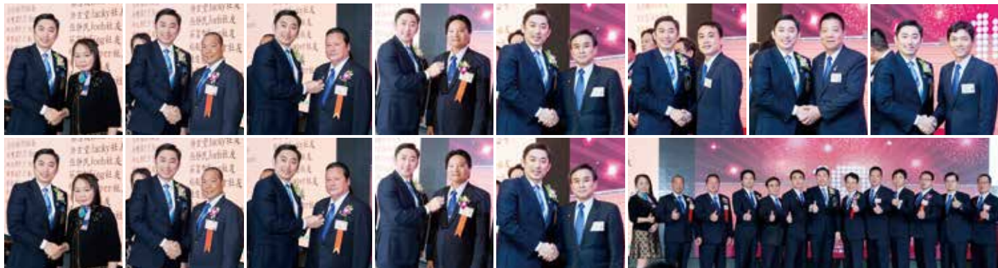
▲中華扶輪教育基金 紀念章