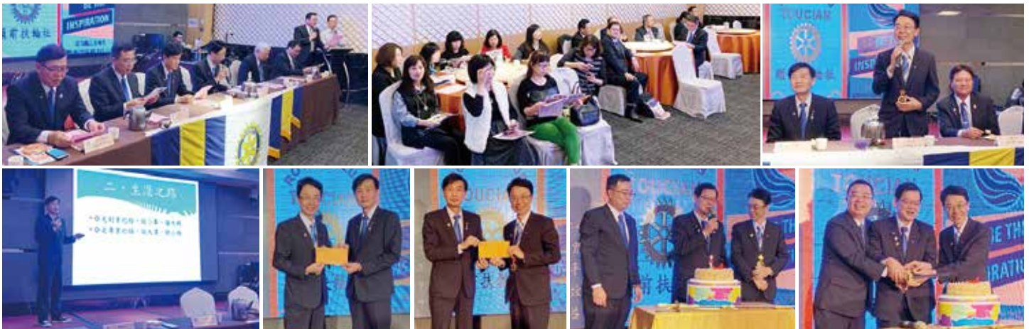
▲講師紀火丁先生 ▲致贈講師車馬費 ▲回捐講師車馬費 ▲4月份慶生活動