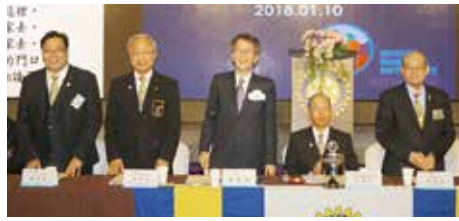
▲感謝貴賓蒞臨參與