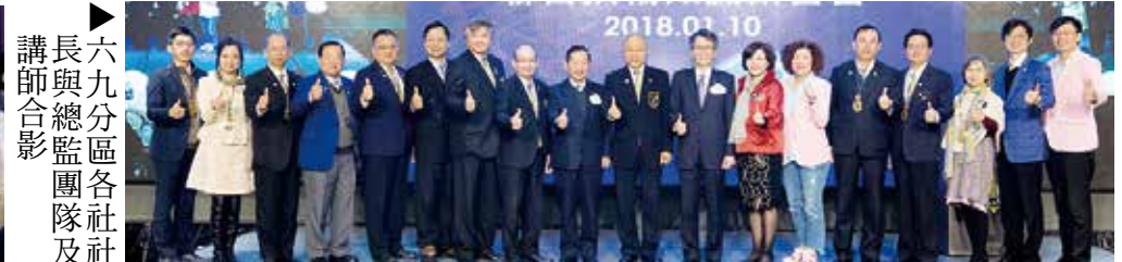
▲六九分區各社社長與總監團隊及講師合影