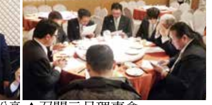
▲PP.Tom分享 ▲召開元月理事會