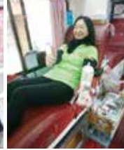
▲感謝社長夫人率先捐血囉