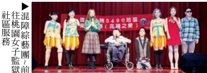
混障綜藝團 往桃園女子監獄 社區服務