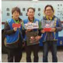
▲感謝捐血中心提供的飲品及餅乾