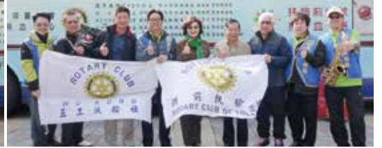
▲感謝前來捐血及打氣的扶輪先進