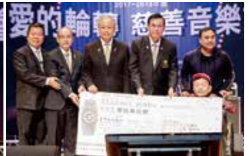
▲高牆之愛混障綜藝團