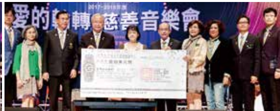
▲新北市愛維養護中心