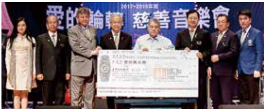
▲新生活社會福利發展促進會