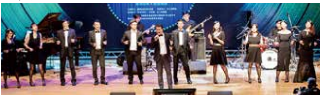
▲台北超級美聲團隊