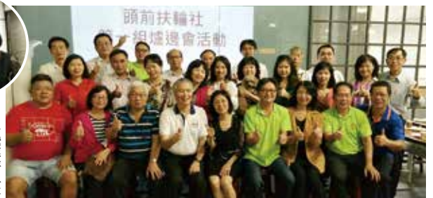
▲第一組爐邊會大成功!