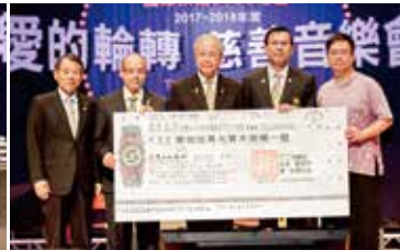
▲中華民國癌友新生命協會