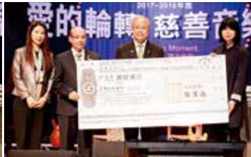
▲花蓮安德啟智中心