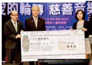
▲宜蘭縣智障者權益促進會