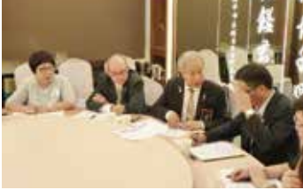
▲總監與社長積極討論中