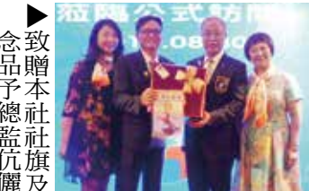
▶致贈本社社旗及紀念品予總監伉儷