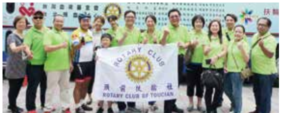
▲與新北光耀社合影