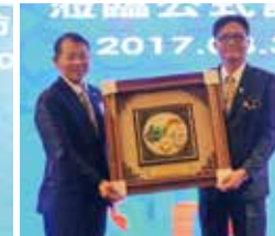
▲2015-16年度團隊致贈社長紀念品