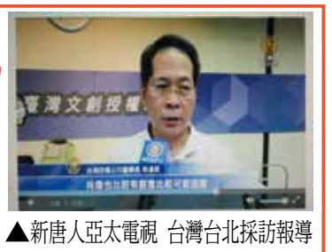
▲新唐人亞太電視 台灣台北採訪報導