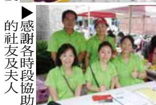
▲感謝各時段協助的社友及夫人