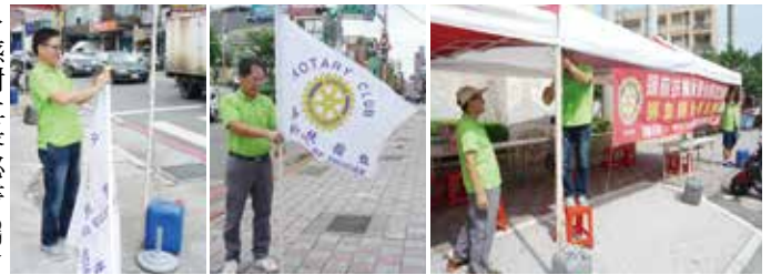
▲感謝社長秘書CPA協助佈置