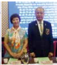
▲歡迎總監 Beadhouse 伉儷