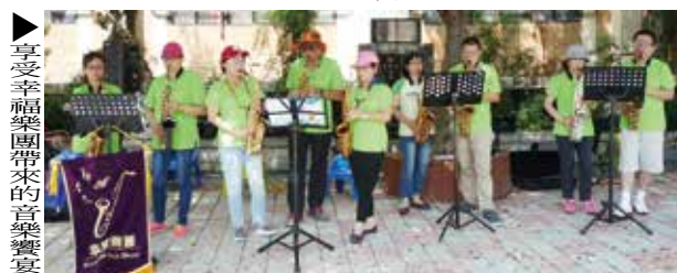
▲享受幸福樂團帶來的音樂饗宴