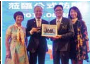
▲總監伉儷致贈社長伉儷紀念品