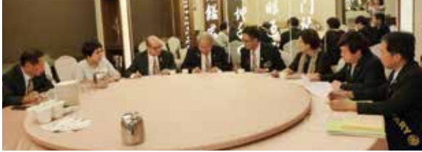
▲總監團隊與社長.秘書.社長當選人會晤