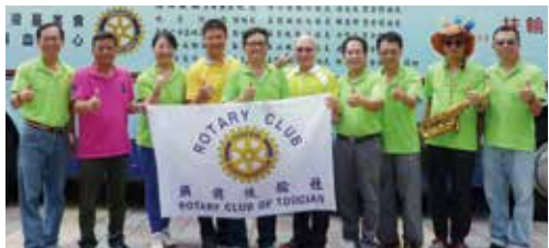
▲與五工社及泰山社秘書合影