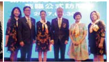
▲與總監及社長伉儷合影