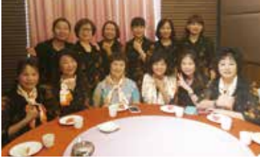
▲總監夫人與夫人們的會前會時光