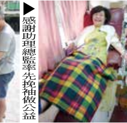
▲感謝助理總監先挽袖做公益