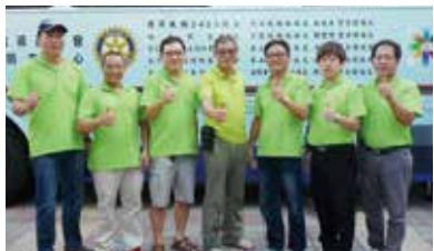
▲與新北圓桌社社長合影