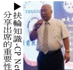
▶扶輪知識-CP-Net 分享出席的重要性