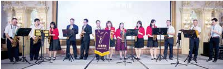
▲歡樂時光~薩克斯風饗宴