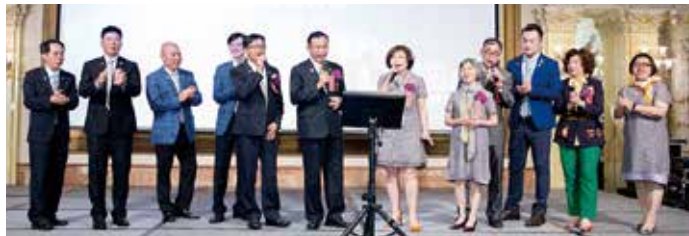
▲今年度團隊獻唱一曲