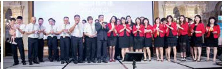
▲本社演唱有緣好兄弟