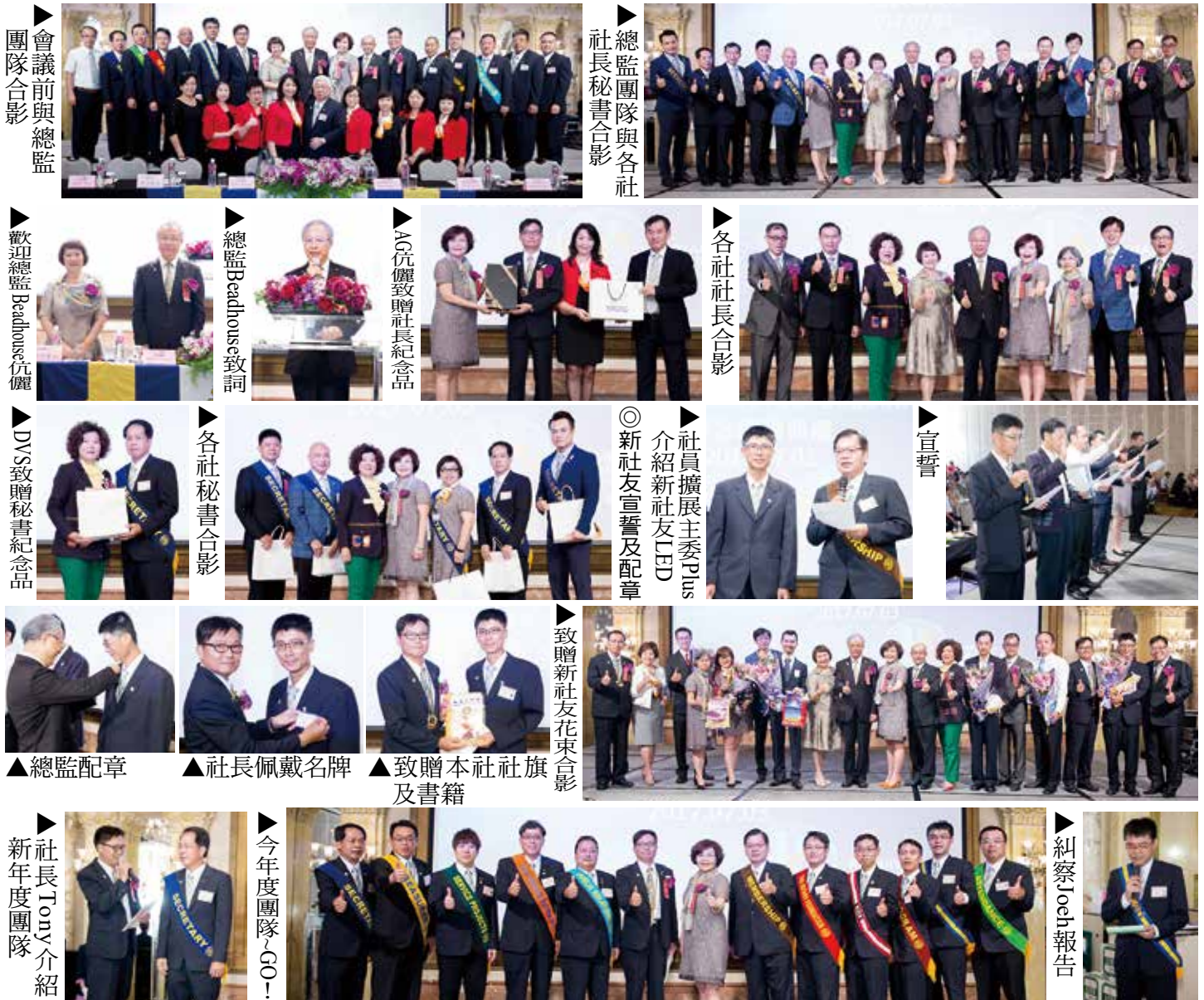
會議前與總監團隊合影