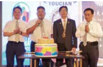
▶祝本月壽星生日快樂!