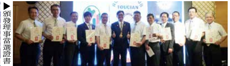
▶頒發理事當選證書