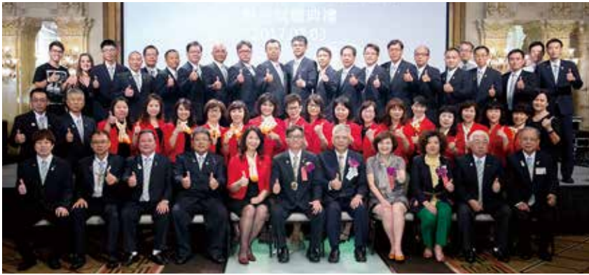
▲就職典禮圓滿成功 1314團隊致贈泰山社社長紀念品▶