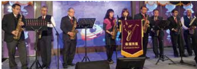
▲幸福薩克斯風樂團演奏