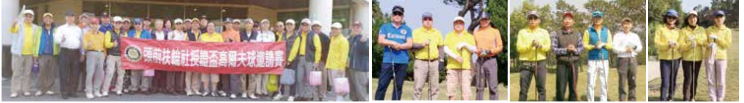
▲授證盃邀請賽開鑼~GO