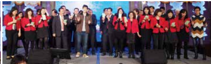
▲本社最後壓軸~獻唱拜大年~