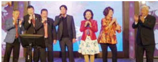
▲第九分區團隊為大家獻唱~恭喜發財