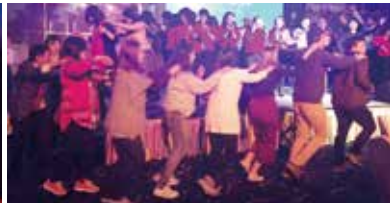
▲全場狂歡~新春團拜圓滿成功 ▲活動花絮