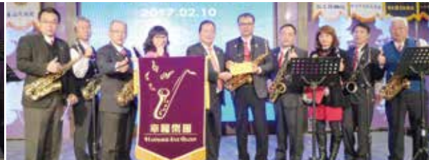
▲致贈幸福樂團禮金