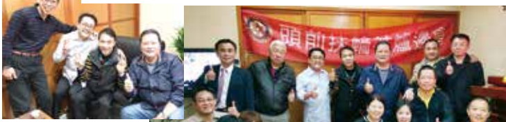
▲▶第三組爐邊小聚~讚!