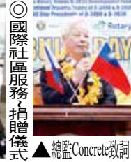
◎國際社區服務、捐贈儀式