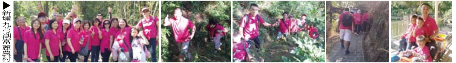
▲新埔九芎湖富麗農村