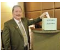
▲社長當選人Muj投入神聖的一票