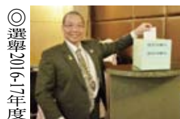
▲社長Scissors投入神聖的一票