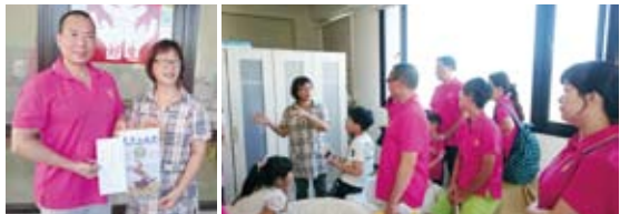
▲社區服務-捐贈儀式 ▲參訪院區