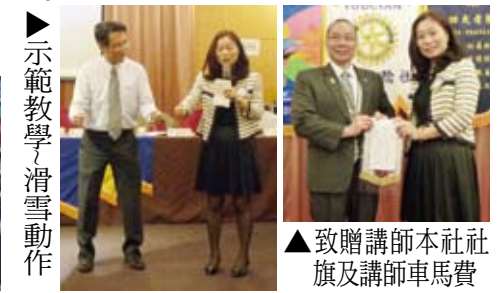
▲示範教學~滑雪動作