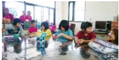
▲社區服務圓滿成功