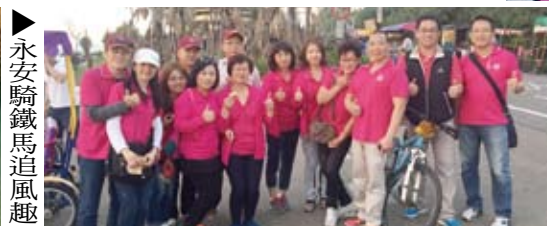
▲永安騎鐵馬追風趣