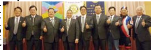
▲感謝助理總監贊助車馬費