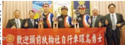
▲歡迎頭前扶輪社自行車環島勇士