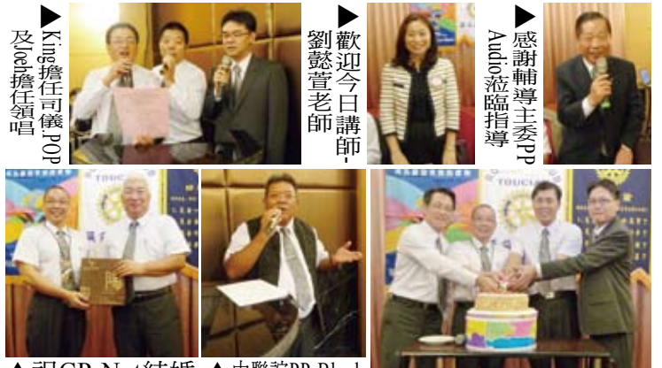
King擔任司儀及主持領唱