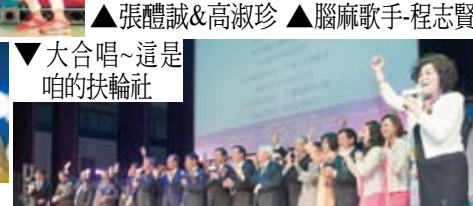
▼大合唱~這是咱的扶輪社