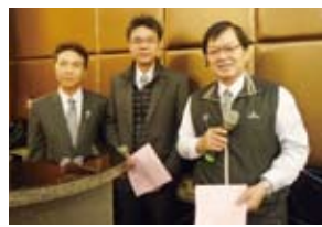
▲Younger擔任司儀.Joeh及Plus擔任領唱