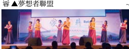
▲癌友新生命~愛與旋轉