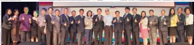
▲與六個受贈單位合影