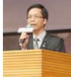
▲主辦社五工社社長 Washer致詞