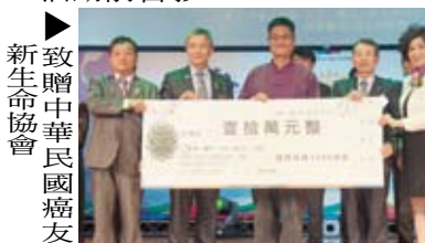
▶致贈中華民國癌友新生命協會