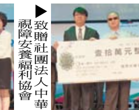
▶致贈社團法人中華視障安養福利協會