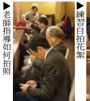
▶老師指導如何拍照