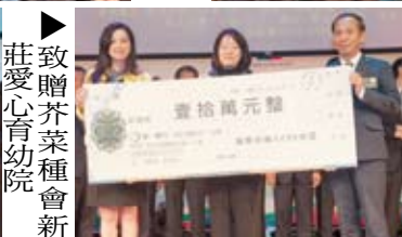
▶莊愛心育幼院致贈芥菜種會新