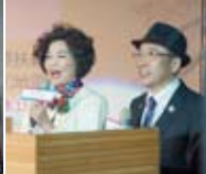
▲美麗及帥氣的主持人