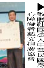
▶致贈社團法人中華民國身心障礙者藝文推廣協會