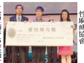
▶致贈中華民國腦性麻痺協會