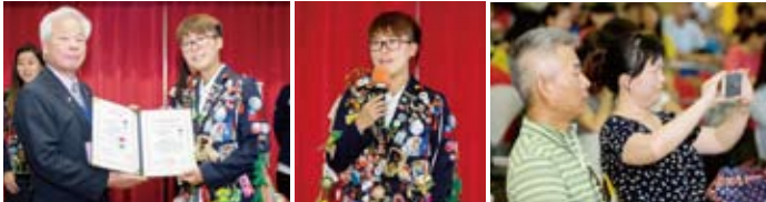
▲頒發親善大使證書 ▲歸國報告~ ▲非常專注