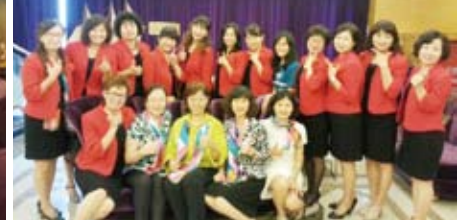
▲內輪會夫人與總監夫人合影