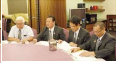
▲社長Scissors報告本社今年度方針