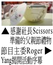
▲感謝社長Scissors準備的父親節禮物 節目主委Roger Yang揭開活動序幕