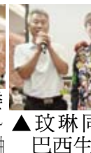
▲玫琳同學分享巴西生活