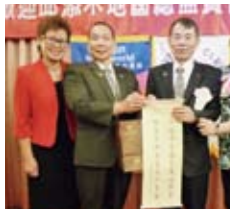
▲致贈助理總監伉儷紀念品