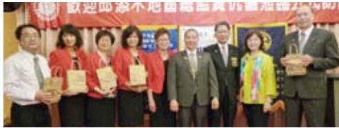
▲社長及總監伉儷致贈紀念品