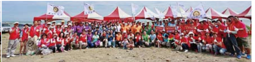
▲第六.九分區全體大合影