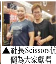
▲社長Scissors伉儷為大家獻唱