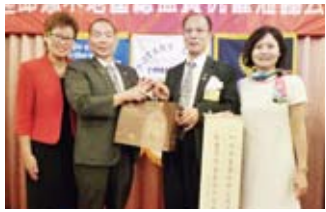
▲致贈地區財務伉儷紀念品