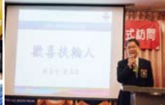
▲總監專題演講-歡喜扶輪人