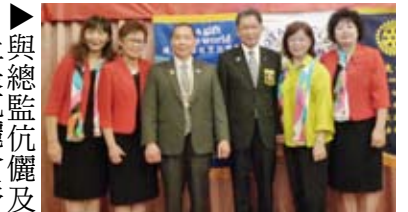
▲與總監伉儷及社長伉儷合影