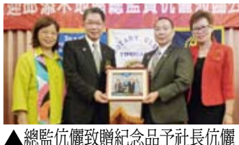
▲總監伉儷致贈紀念品予社長伉儷