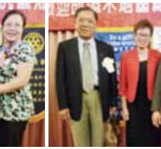
▲致贈祿姆及輔導主委紀念品