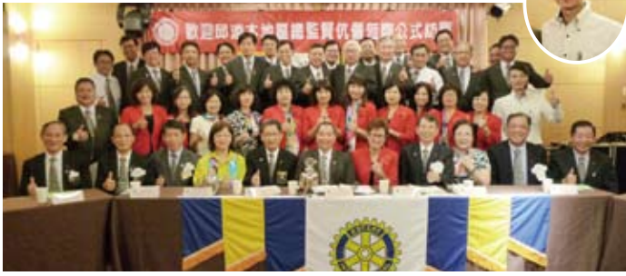
▲總監公訪圓滿成功！