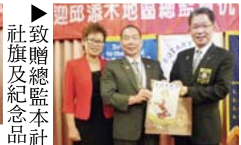
▲致贈總監本社社旗及紀念品