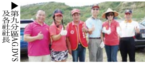
第九分區AG DAYS及各社社長