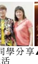
▲分享中皆是滿滿的感動