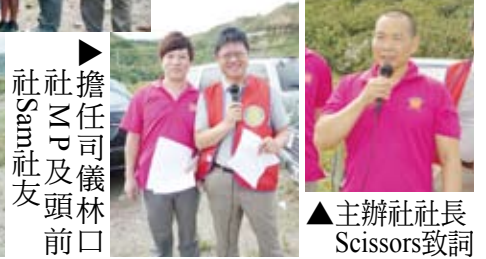
擔任司儀林口社NP及頭前社Sam社友