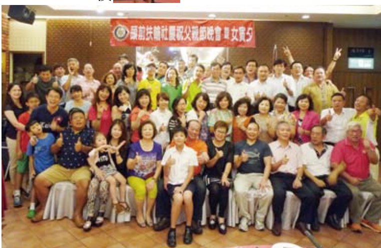
▲父親節活動~大成功!