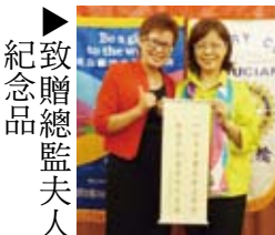
▲致贈總監夫人紀念品