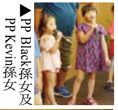
▶PP Black孫女及PP Kevin孫女