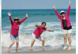
▲等待中也不忘放鬆一下