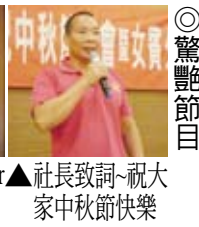
▲社長致詞-祝大家中秋節快樂