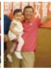
▶中秋節活動圓滿成功