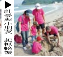
▶社長與小朋友一起抓螃蟹