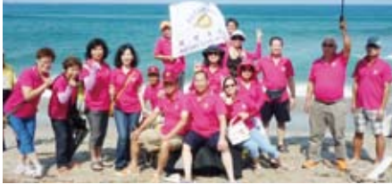
▲牽罟活動準備開始