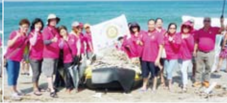
▲與遊艇.撒網工具合影