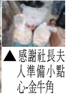
▲感謝社長夫人準備小點心-金牛角