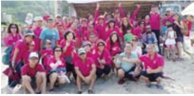
▶牽罟活動圓滿成功