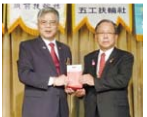
▲總監贈社長小禮物