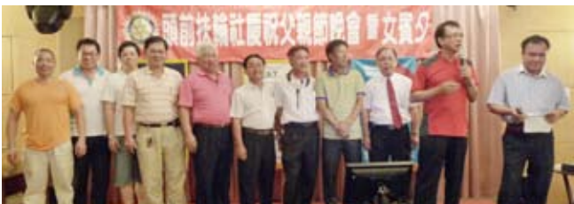
▲本社薩克斯風成員