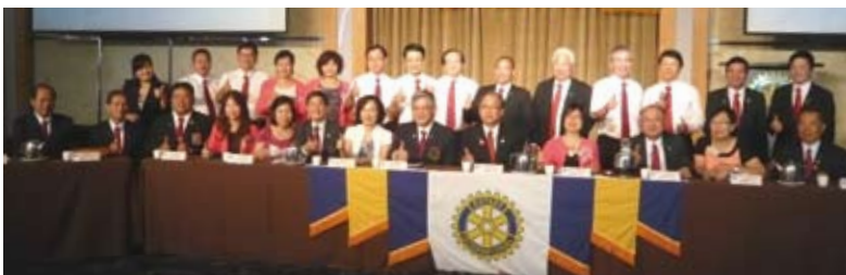
▲公式訪問圓滿成功！