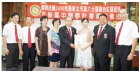
▲致贈本社社旗予五股國中