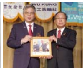
▲總監贈社長紀念品