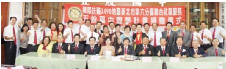
▲本分區參加社友、寶眷全體合影