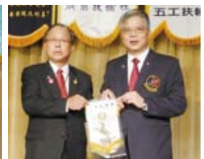
▲社長致贈本社旗予總監