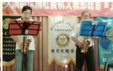
▲由社長與秘書率先大展身手