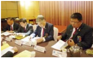
▲總監團隊與社長、秘書會晤