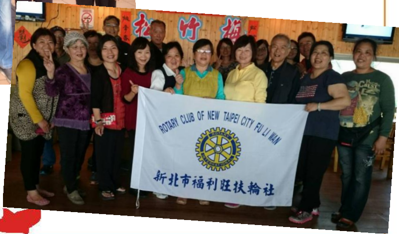
松竹梅餐廳大合照