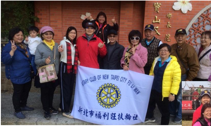
秋季旅遊-山上人家照片