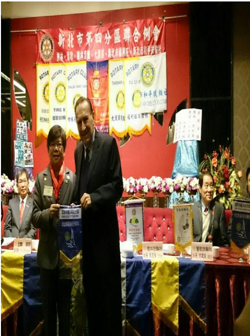
致贈講師談約翰小社旗參