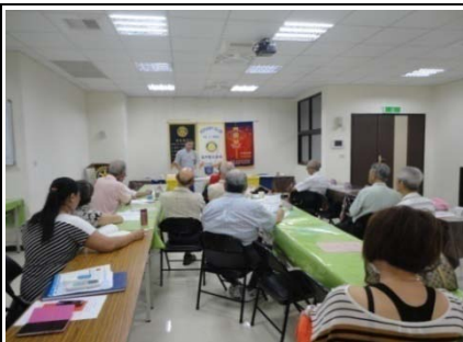
主題講座受益無窮

言之，生活當中「圖像」不但能增進自己的記憶力也能學習與人相處之道，從而得到善好因緣，的確非常有趣喔！