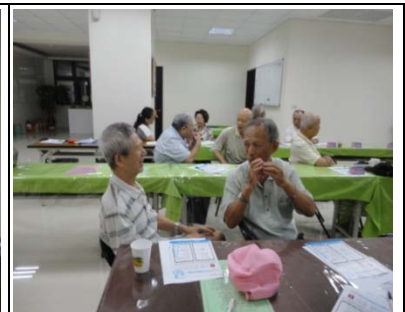
倆人一組互相練習