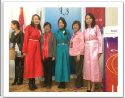
WCS 世界社區服務&職業訓練隊 VTT 協助外蒙古建立國家的口腔健康照顧計劃