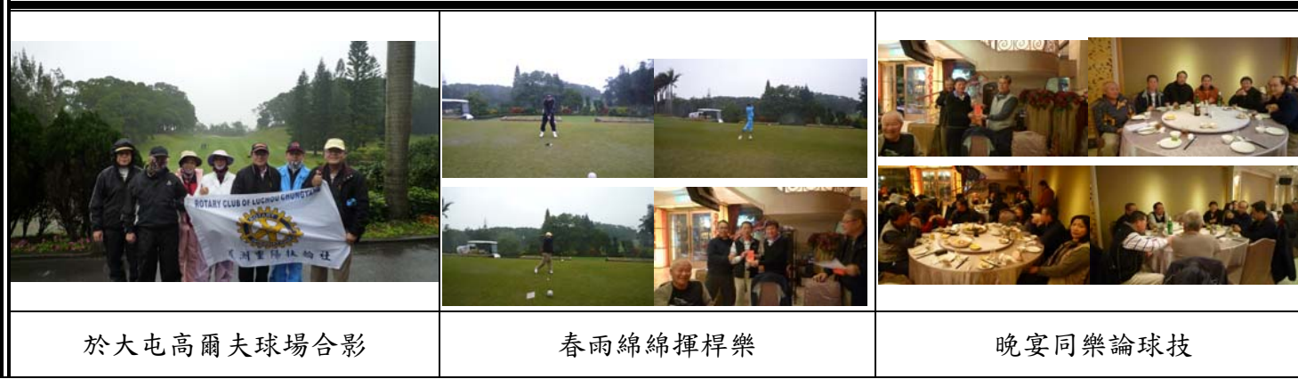
於大屯高爾夫球場合影