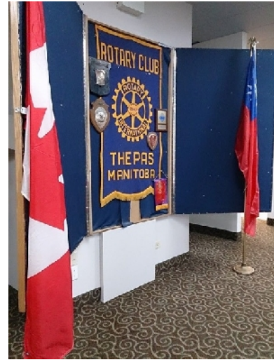
他們為了我還特地掛上了台灣的國旗，每次例會的時候都會拿出來喔。