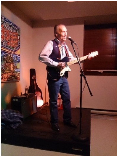
這次我去聽的藍調演唱，非常享受