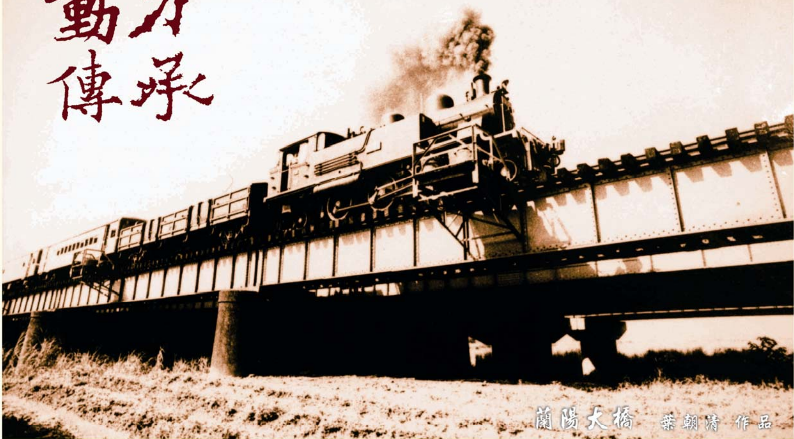
蘭陽大橋 葉朝清 作品