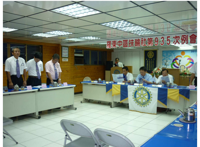
友社社友參加例會