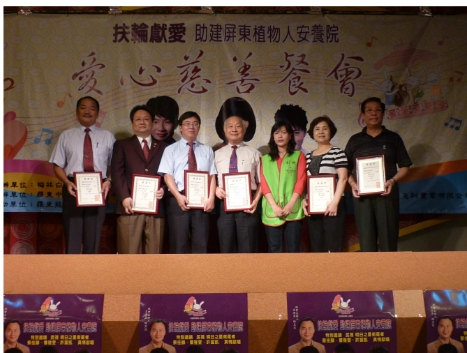
助建屏東創世植物人建院~愛心餐會