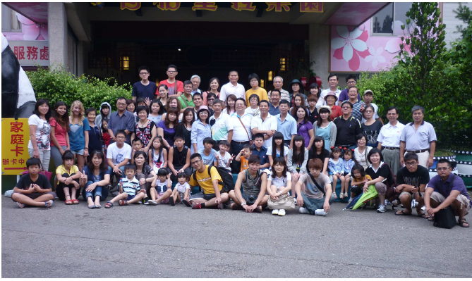
夏季旅遊～溪頭之旅