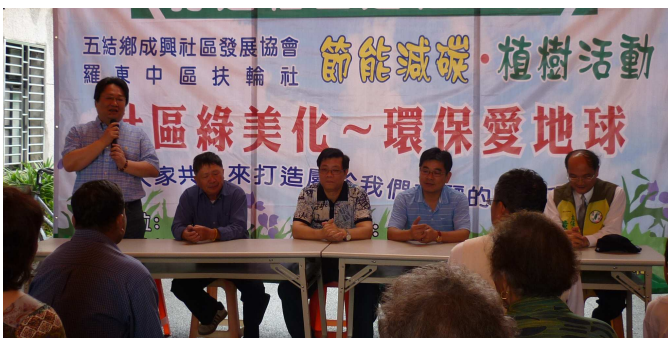
與五結鄉成興社區共同打造社區綠化環境