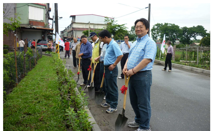
植樹減碳活動~種樹囉