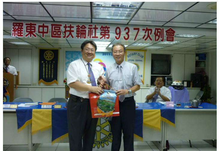
3480 地區中和東區扶輪社蒞社專題演講