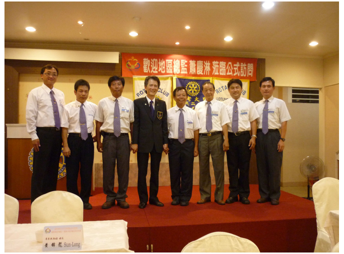
總監公式訪問～中華扶輪基金配章