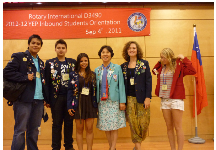
YEP Inbound 歡迎會