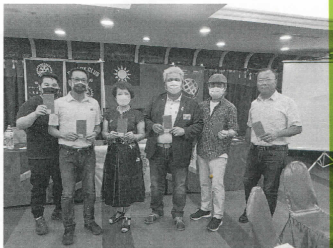
三月份出席百分百獎

基隆扶輪社 第 3479 次例會 時間：2022 年 4 月 26 日 地點：基隆柯達飯店十樓 一、社員出席： 出席人數： 15 人 請假： 11 人 補出席： 0 人 免計： 4 人 社員人數： 30 人 出席率： 57.69% 二、好久不見的社友我們很想念您喔！