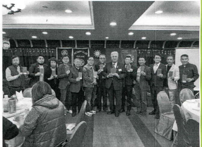
2 月份出席百分百獎