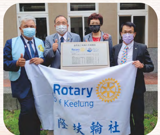
地區獎助金暨基隆分區九社聯合社區服務 「瑞芳高工綠美化永續園區計畫」捐贈活動