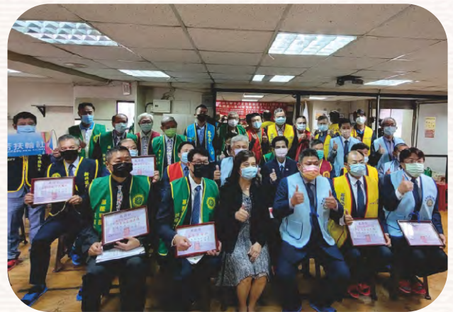
基隆分區九社聯合社區服務「大光兒少之家設備更新計畫」捐贈活動