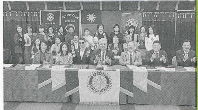
寶眷夫人與總監大合照