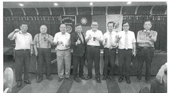
Alashi 社長頒發出席百分百獎