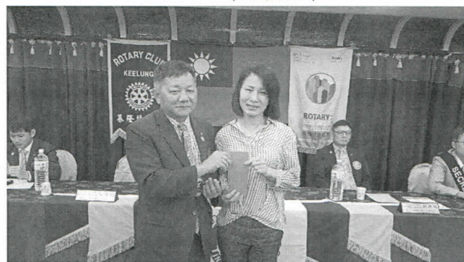
社長致贈慰問金給 Elevator 社友岳母