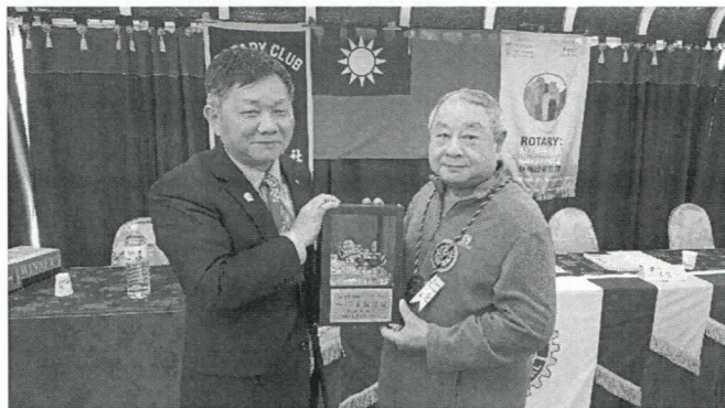
Alashi 社長感謝各位前社長，贈送每位前社長一份禮品