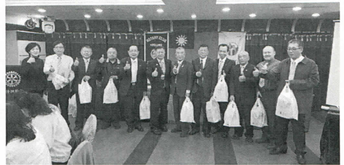
9 月份出席百分百-第一組