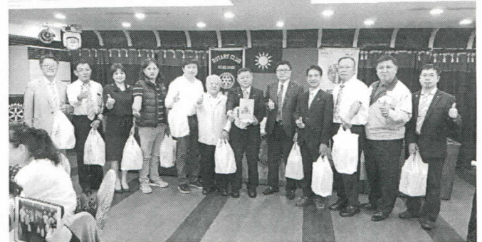
9 月份出席百分百-第二組