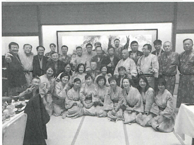
八戶姐妹社舉辦歡迎會