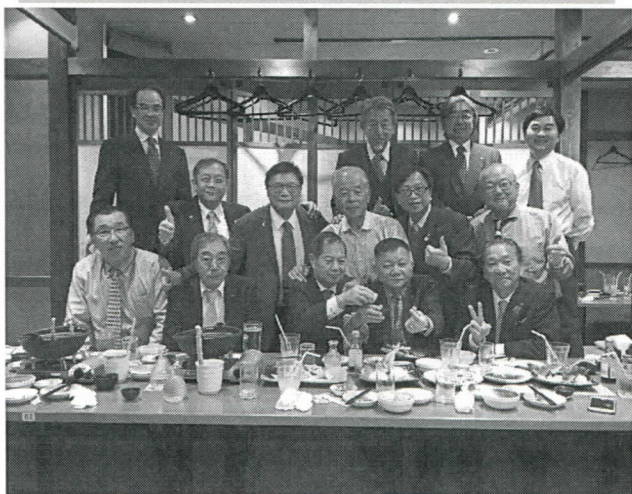
訪問那珂湊友好社