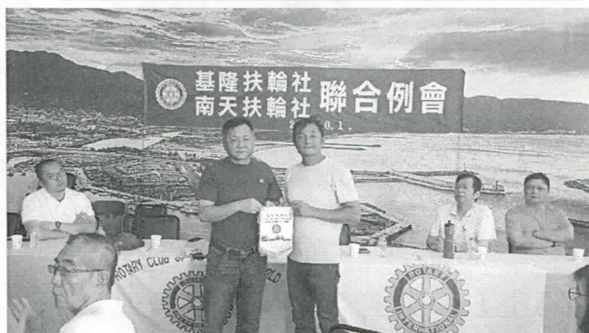
與南天社聯合例會