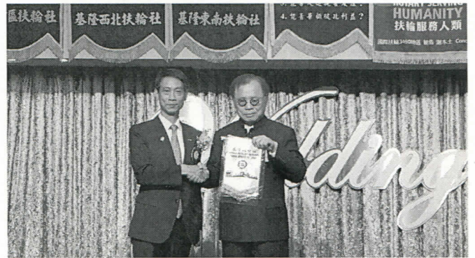
社長致贈小社旗給主講人