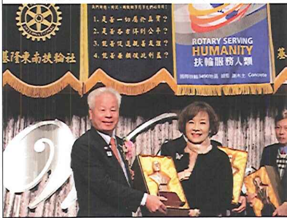
巨額捐獻-Carato PP 夫人代理受獎