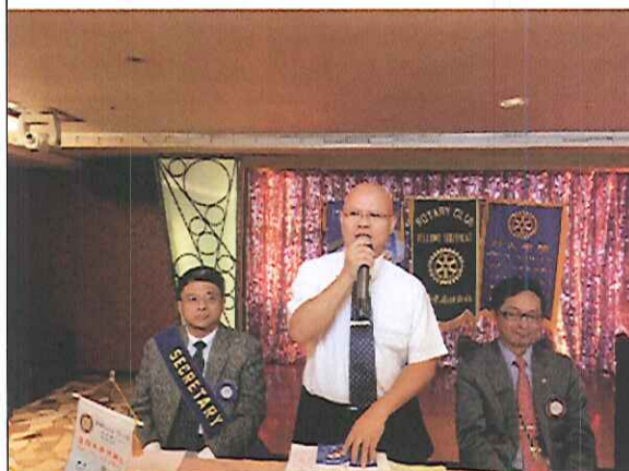
常年大會選舉結果