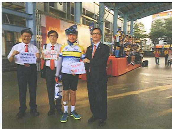
為 PP Tea 加油