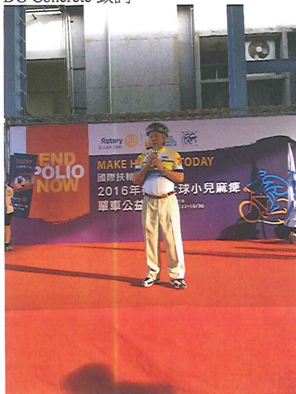
DG Concrete 致詞