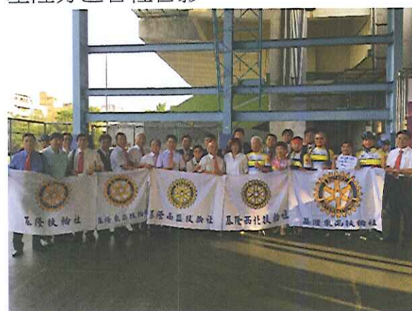
基隆分區各社合影