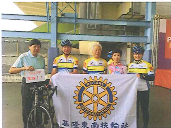
PP Tea 參加今年度單車環島之旅