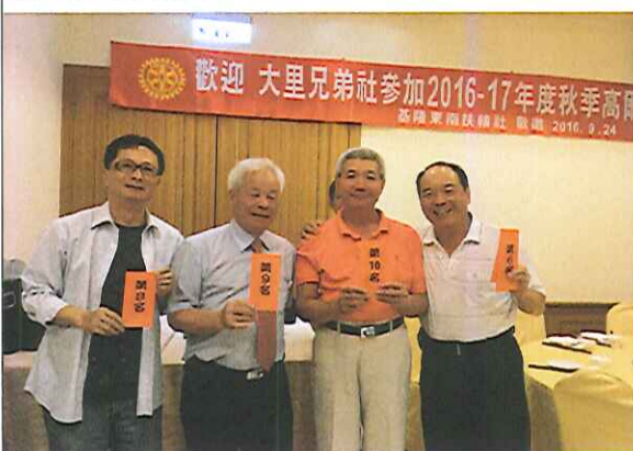
前 10 名的高手