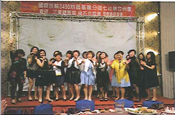
總監夫人與本社夫人