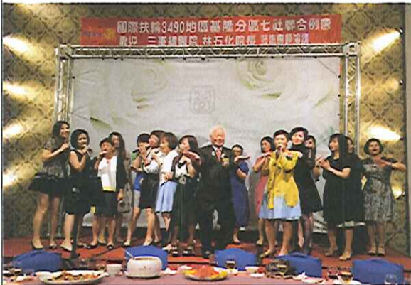
總監賢伉儷與七社社長歡唱