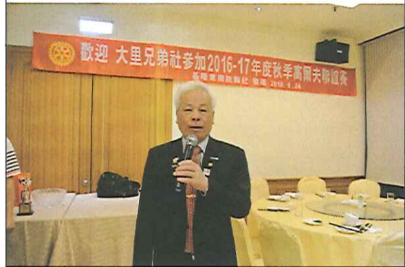
本社致贈大里社伴手禮