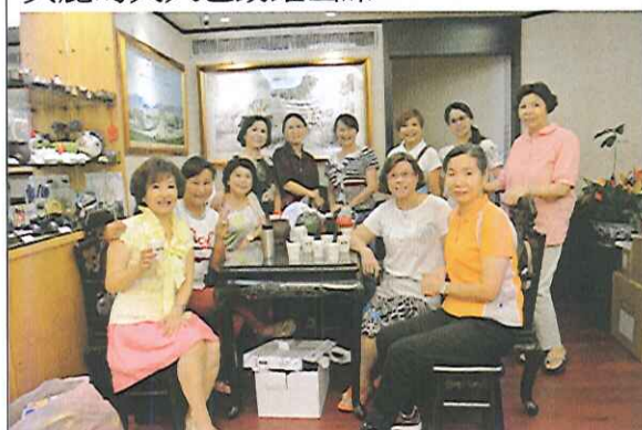
美麗的夫人也踴躍出席