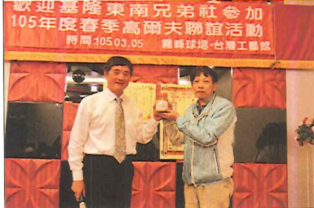
大里社兄弟社主委致贈本社伴手禮